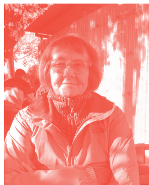
Montserrat Selga Xarxa de suport d’HORTS socials i comunitaris

“Soc usuària de l’hort de les Caputxines, un dels horts que aplega aquesta xarxa d’HORTS socials i comunitaris que ha impulsat la Comunalitat.